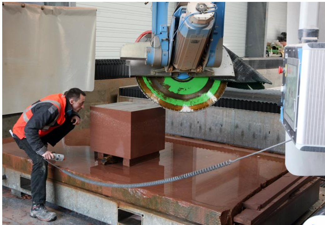
Une machine à commande numérique 5 axes complète l'outillage traditionnel.

Au bout d'énormes couloirs en impasse, bien éclairés, des haveuses électriques découpent tranquillement des blocs d'une masse unitaire de 24 tonnes. Après sciage sur trois mètres de profondeur des quatre côtés accessibles, des coussins métalliques emplis d'eau sous pression sont insérés dans les traits de coupe. Il suffit de les gonfler légèrement pour fendre la masse à l'arrière. Les carriers de Haute Égypte utilisaient déjà pareil procédé pour extraire leurs obélisques. Mais ils ne disposaient pas des puissantes tractopelles qui pren-